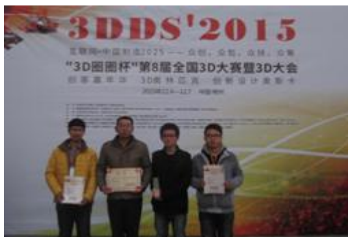
图18“3D圈圈”杯第八届全国3D大赛