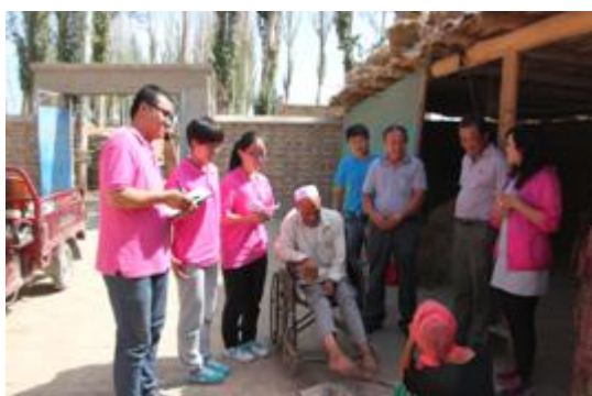
图 26 精准扶贫调研团队员们与贫困户交谈现场