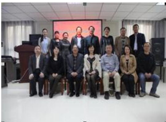
图 7 人文学院人才培养方案论证会