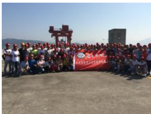
图 12 水利与建筑工程学院实习基地