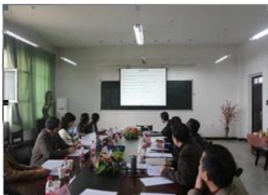
图4 动物科学学院人才培养方案论证会

本次人才培养方案论证工作的圆满完成对学校加强专业建设，提高教学质量，强化学生创新意识，提高学生实践能力，走内涵发展道路有很大的推动作用。