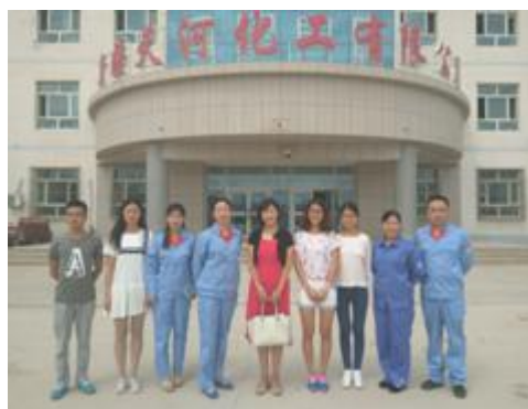
图 13 经济与管理学院实习基地