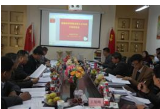
图 11 植物科学学院人才培养方案论证会