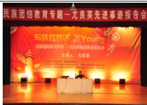
图 28 青春创富故事-优秀兵团青年电商走进我校 图 29 与信仰对话-尤良英先进事迹报告会