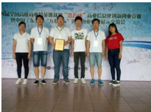
图19全国高校商业精英挑战赛“浩方杯”商业信息化创新创业竞赛