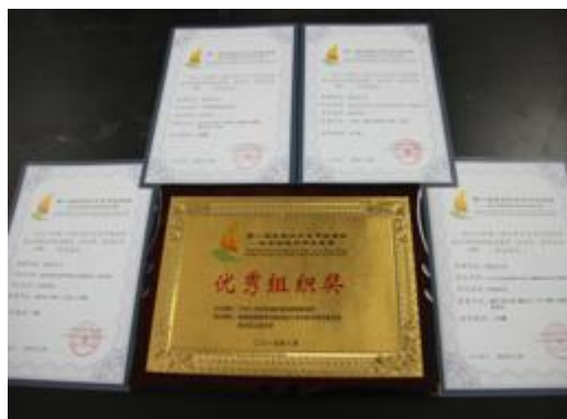
图20第八届全国大学生节能减排社会实践与科技竞赛