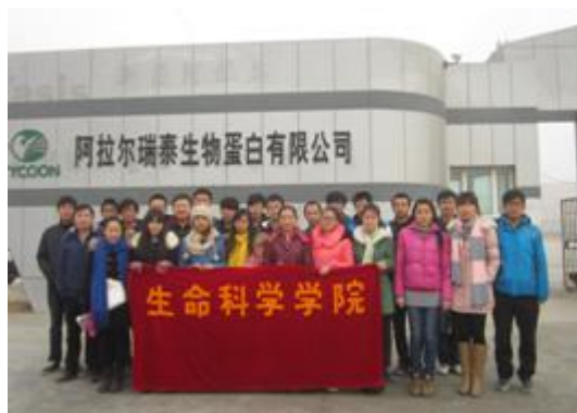
图 14 生命科学学院实习基地