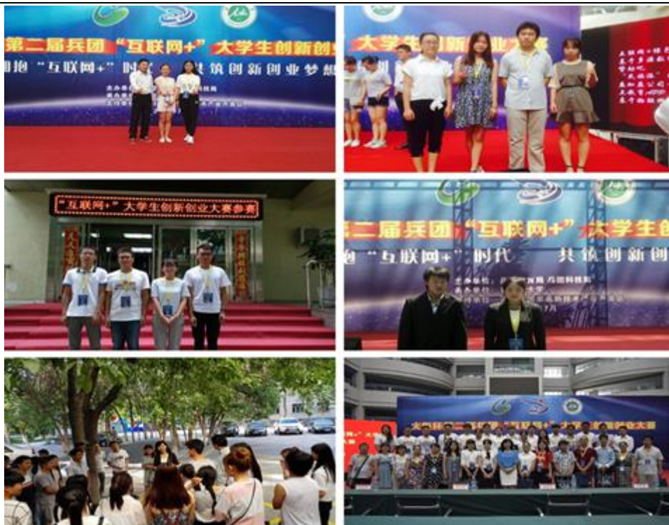
图 21 第二届兵团“互联网+”大学生创新创业大赛