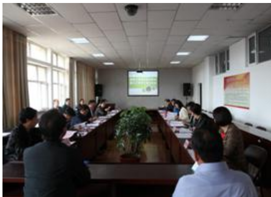
图 6 经济与管理学院人才培养方案论证会