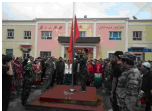
图 24 民族团结宣讲团泽普县赛力乡依玛乡与驻村工作组成员升国旗

乡优秀组织奖 1 项、优秀团队 9 个，先进个人 15 人，优秀指导老师 5 人。校级优秀组织奖 8 个，优秀团队 15 支，优秀指导老师 17 名，先进个人 207 名。社会实践团队充分发挥了宣传队、服务队、融情队的作用，较好地服务了新疆尤其是南疆的长治久安和社会发展，共受到兵团电视台、兵团网、大学生网等 154 家媒体报道，得到了社会各界的一致好评和肯定。