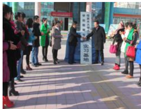
图 15 人文学院实习基地挂牌