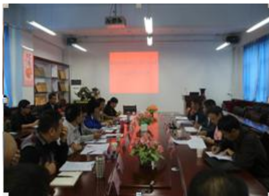
图5 机械电气化工程学院人才培养方案论证会