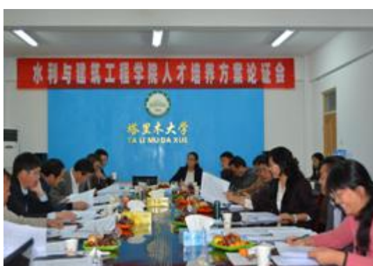
图 9 水利与建筑工程学院人才培养方案论证会