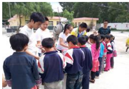
图 27 支教的学生帮助孩子们建立起“爱心书屋”