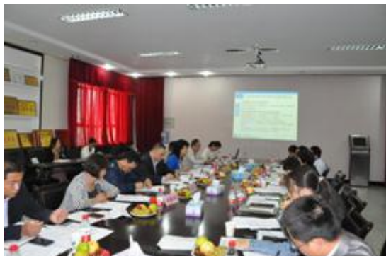
图 10 信息工程学院人才培养方案论证会