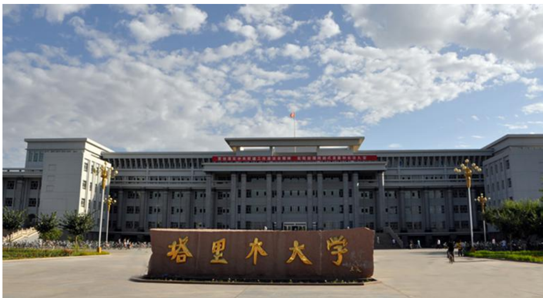
图 1 塔里木大学综合教学楼

在新的历史时期，学校将继续立足南疆、面向兵团、服务新疆，按照“做塔里木文章、创区域性优势、建综合性大学”的发展思路，坚持“稳定规模、调整结构、提高质量、办出特色”的方针，以高校对口支援为契机，全面提升人才培养、师资队伍、学科建设水平，不断提高整体办学能力，为新疆的社会稳定和长治久安做出更大贡献。