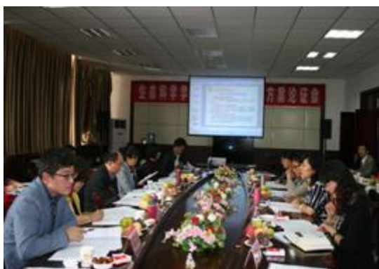
图 8 生命科学学院人才培养方案论证会