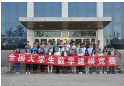
图17高教社杯全国大学生数学建模竞赛