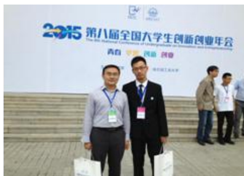
图 23 塔里木大学入选 2015 年全国大学生创新创业学术年会作品师生