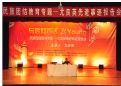
图 28 青春创富故事-优秀兵团青年电商走进我校 图 29 与信仰对话-尤良英先进事迹报告会