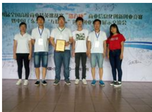
图19全国高校商业精英挑战赛“浩方杯” 商业信息化创新创业竞赛