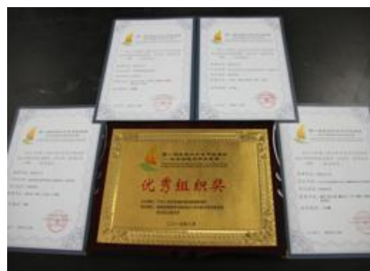
图20第八届全国大学生节能减排 社会实践与科技竞赛