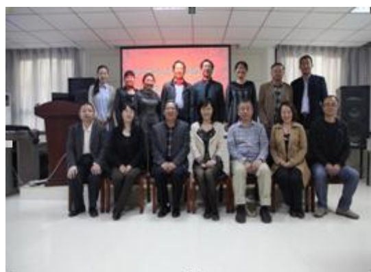
图 7 人文学院人才培养方案论证会