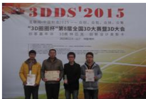
图18“3D圈圈”杯第八届全国3D大赛