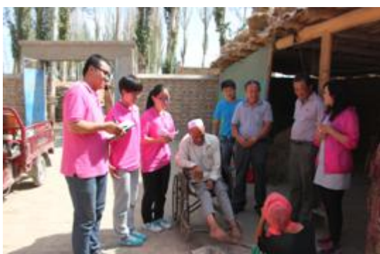
图 26 精准扶贫调研团队员们与贫困户交谈现场